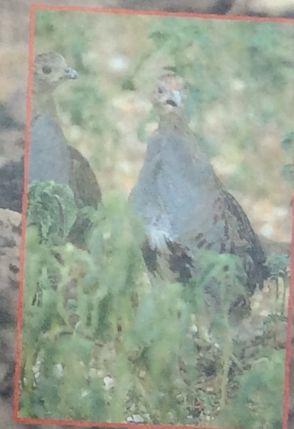
(R. MASSOLI - NOVELLI)

Volete sapere che aria si respira nell'azienda faunistico venatoria di Acquafondata? Andate a leggervi il bellissimo All'insegna della caccia di E. Antonio Grossi. Ma attenti, perché dopo non potrete fare a meno di voler rivivere di persona quelle emozioni Testo di Marco Ramanzini